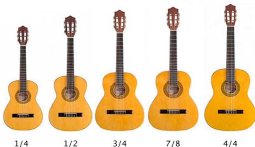
Porovnanie veľkostí klasických gitár